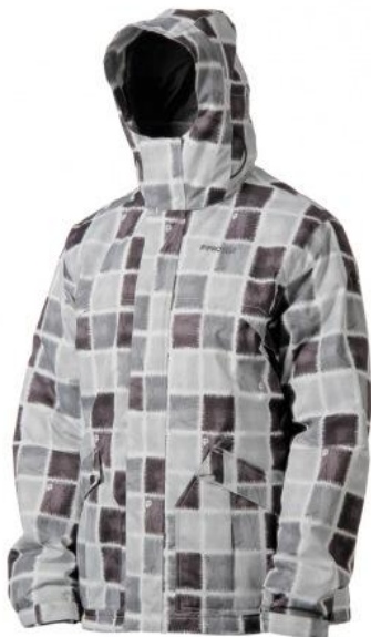
pánská zimní bunda Winson