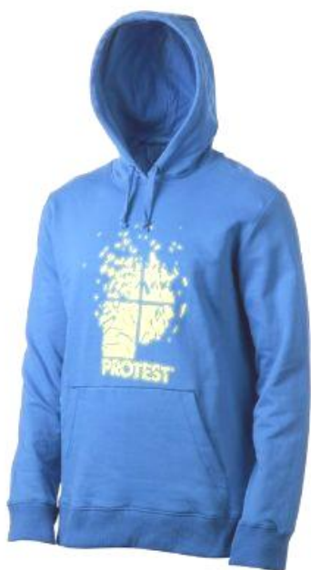
pánská mikina Gidding