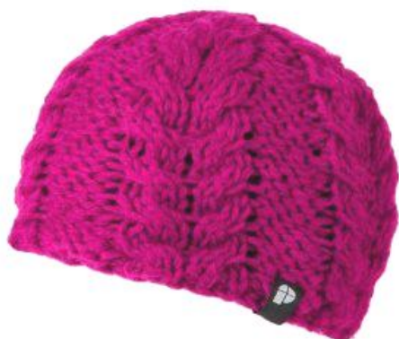
čepice Biscuit 10