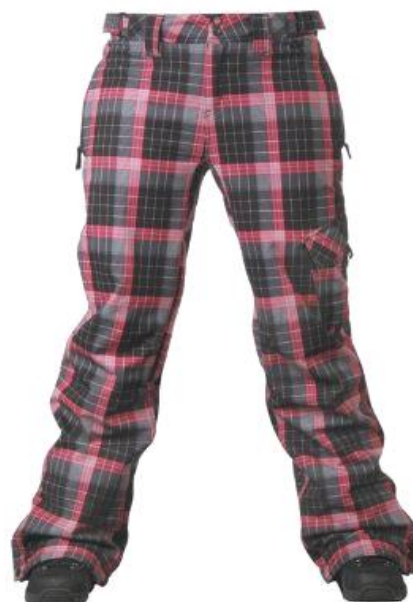
dámské zimní kalhoty Gazely