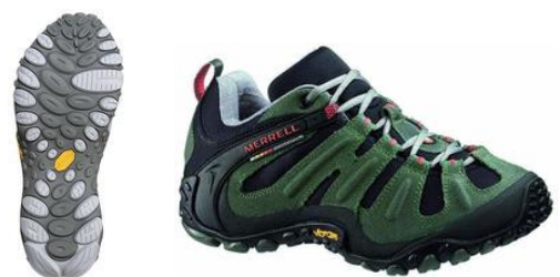
CHAMELEON WRAP SLAM