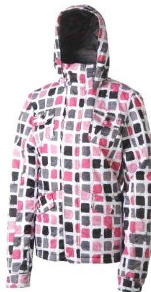
dámská zimní bunda Forest