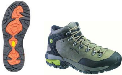
COL MID GTX