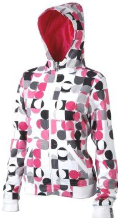
dámská mikina Loversall