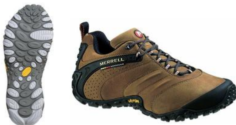
CHAMELEON II LEATHER