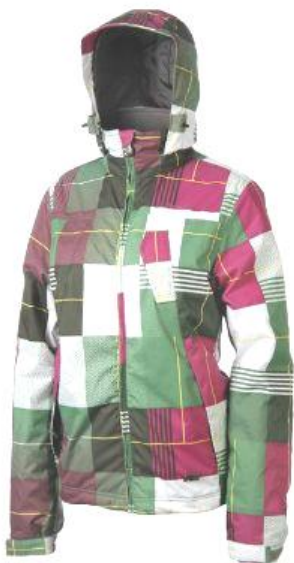
dámská zimní bunda Warton