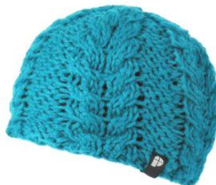
čepice Biscuit 10