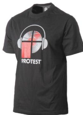
pánské triko Bigby