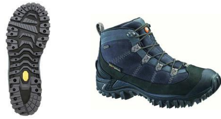
QUARK MID WTPF