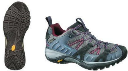
SIREN SPORT GTX XCR