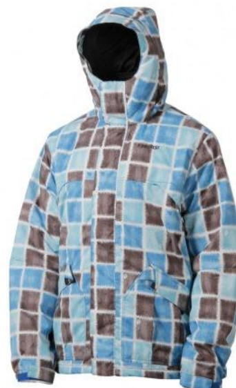
pánská zimní bunda Winson