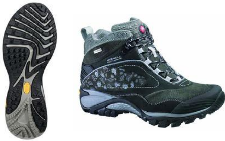
SIREN WTPF MID II